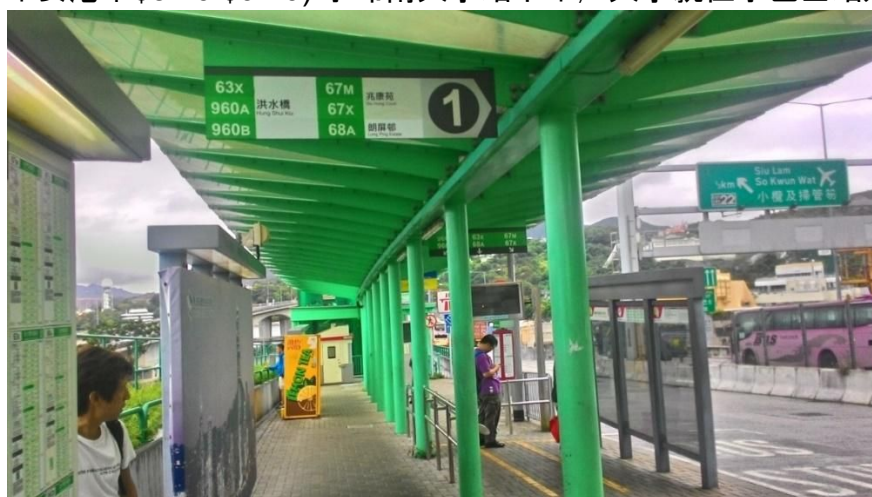
屯门公路转车站图片